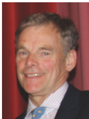
Fig 1 Prof Dr Dr Reich presented the introductory lecture on the complex conference topic.